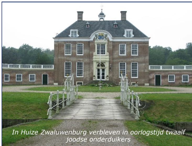
In Huize Zwaluwenburg verbleven in oorlogstijd twaalf joodse onderduikers

De noordelijke route gaat naar Oosterwolde, Oldebroek en Noordeinde. Totale lengte is ca. 45 km. Deze route gaat een stukje de provinciegrens over en passeert op de Hogeweg te Kamperveen de boerderij waar Leni Duyzend in mei 1943 onderdook. Langs het Reevediep gaat de route naar de Gelderse Sluis, waar weduwe Hermina Dekker, alom bekend als Mie van de Sluze, in en rondom de sluiswachterswoning aan drieëntwintig onderduikers onderdak verleende, waaronder vier joden.